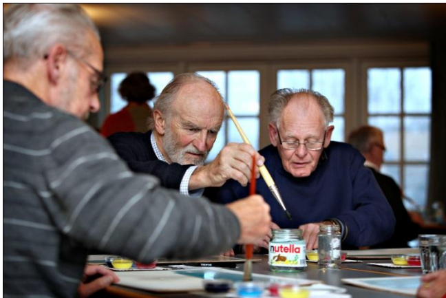
Active therapy for people with dementia Alzheimer Association 2011