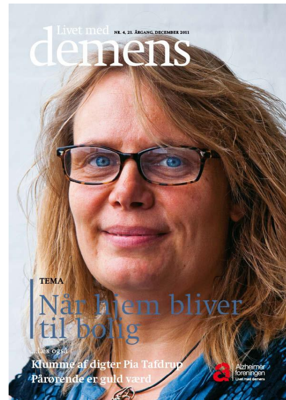
Living with dementia Magasin of Alzheimer Association 2011