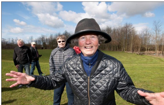
Active therapy for people with dementia Alzheimer Association 2012