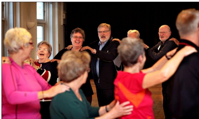
Active therapy for people with dementia Alzheimer Association 2010