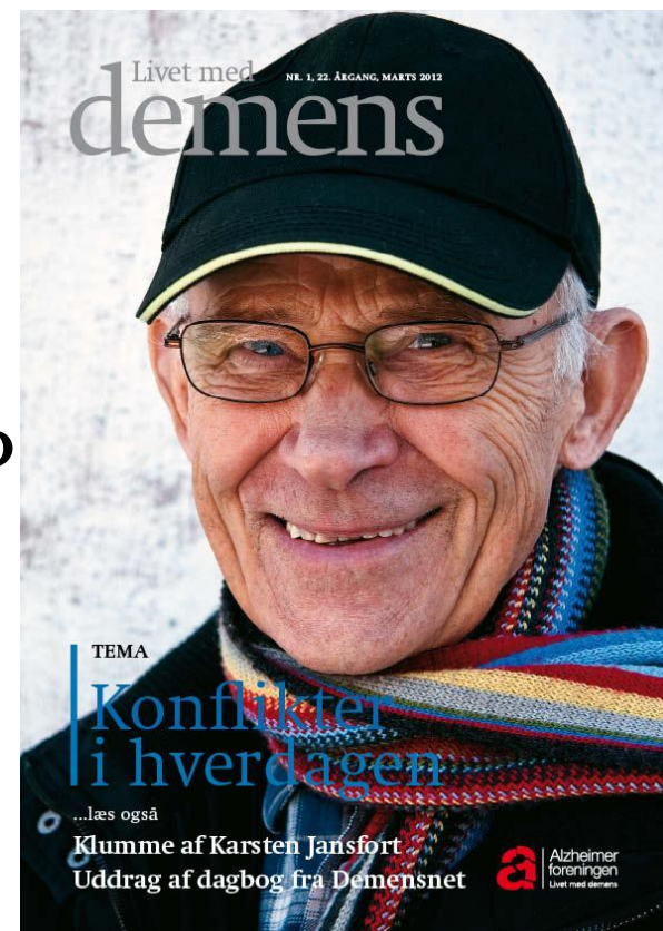
Living with dementia Magasin of Alzheimer Association 2012