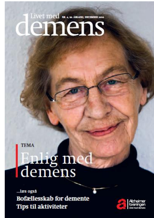
Living with dementia Magasin of Alzheimer Association 2010